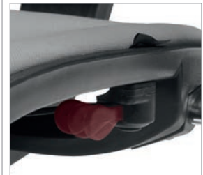
Bloqueio da costa na posição vertical por deslocação do manípulo.