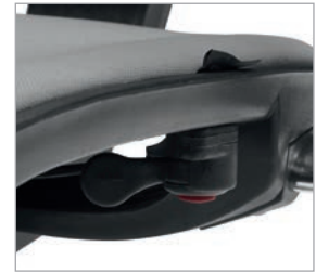
Desbloqueio da costa na posição vertical por pressão do botão inferior.