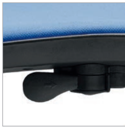
Regulação da altura por elevação a gás.