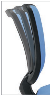
Oscilação da costa em 15°.